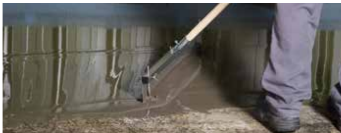
5 De vloeregalisatiemassa wordt met een getande vloerwisser over grotere oppervlakken verdeeld