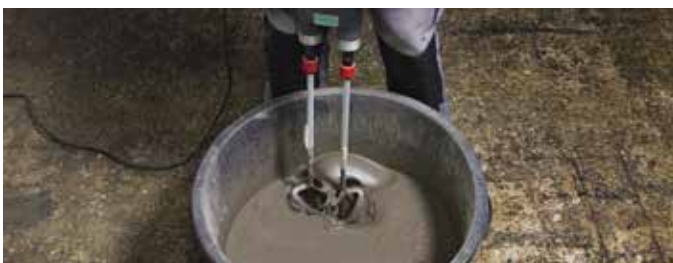
3 Minimaal drie minuten intensief mengen met een geschikte mixer