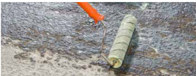
2 Grondering met KÖSTER SL Primer