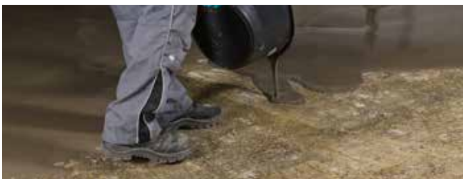
4 Verdeel direct na het mengen in de gewenste laagdikte