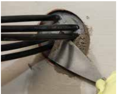
5 ... makkelijk...