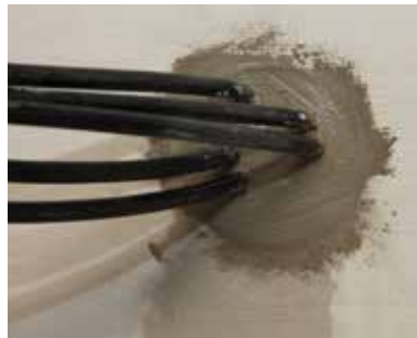
6 ... en duurzaam afgedicht.