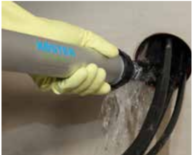
1 Een lekkende ...