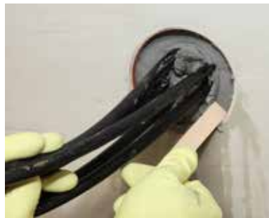
4 ... direct, eenvoudig,...