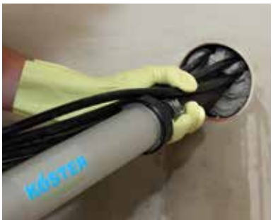
3 ...met KÖSTER KB-Flex 200...