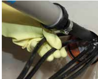
2 ...kabeldoorvoer wordt...