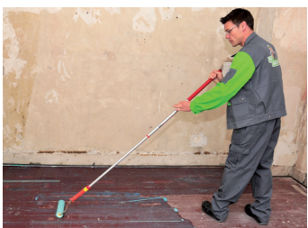
2. Grondering met KÖSTER VAP I 06