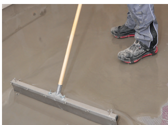
5. Op grotere oppervlakten verdelen met een kamspaan