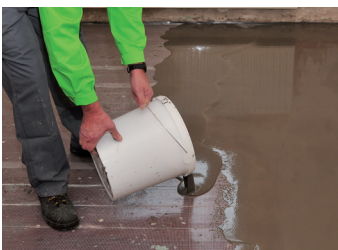
4. Direct na het mengen (min. 3 minuten) in de gewenste laagdikte verdelen