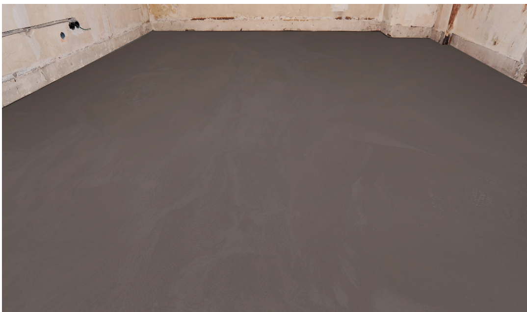
Het resultaat: een snelle en zekere uitgevoerde vloeregalisatie